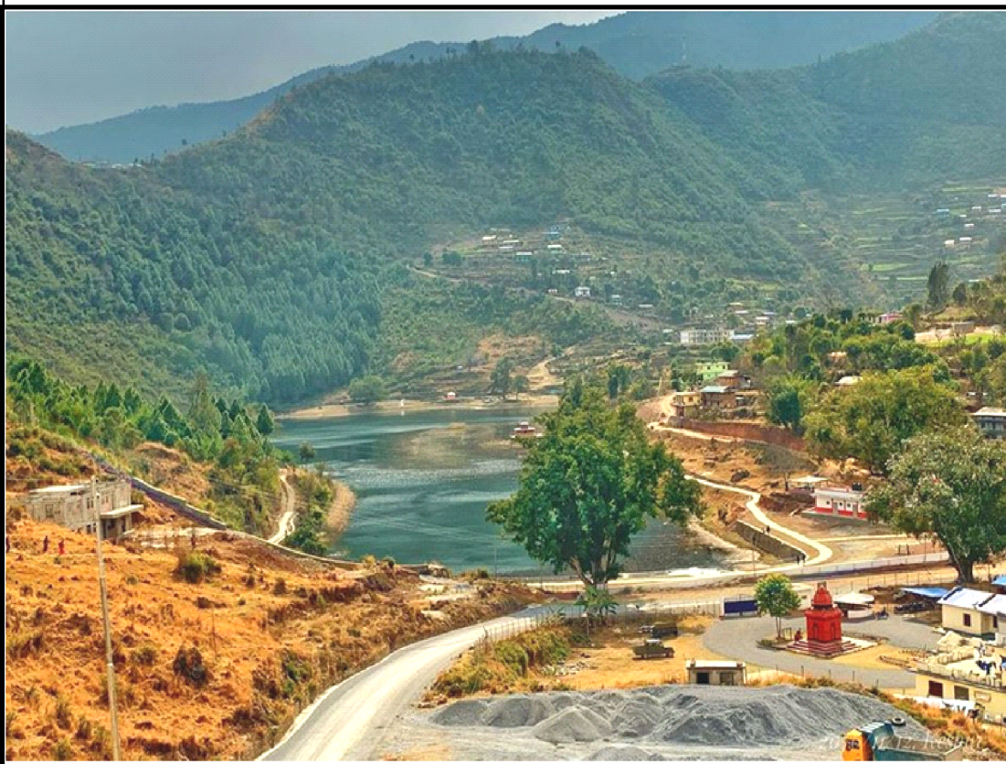
नेपालको एक मात्र कमलफूल फुल्ने कमलताल । रुकुम पूर्वको सिस्ने गाउँपालिका ५ मा अवस्थित तालको वरीपरि भौतिक पूर्वाधार निर्माण गरीएको छ । तस्वीर - रेखदेख