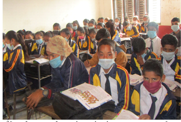
भौतिक दुरी कायम नगरी कक्षा कोठामा कोचाकोच अवस्थामा पढ्न बाध्य त्रिभुवन जनता माध्यामिक विद्यालयका विद्यार्थीहरू ।