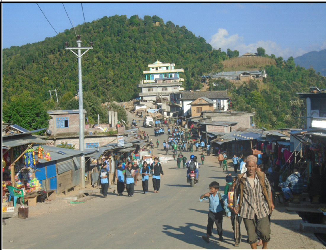
रुकुम पूर्व-पश्चिमको मुख्यद्वारको रूपमा रहेको भुल्लेटा बजार । कोरोना कहरैबीचमा बजार खुलेपछि बजारमा चहलपहल बढेको छ । रेखदेख