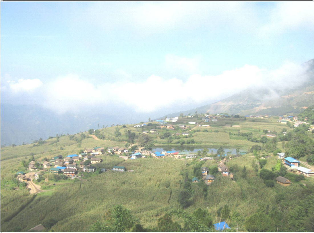
रुकुम पश्चिमको रमणीय साँख गाउँ । असोजको दोस्रो साता बारीमा पाकेको मकै र गाउँको बीचमा रहेको साँख दहले गाउँको सुन्दरता थपेको छ । तस्वीर रेखदेख