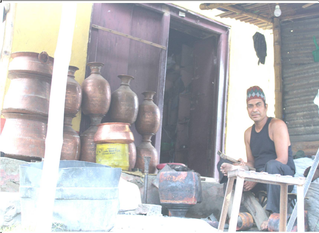
रुकुम पूर्वको रुकुमकोटमा तामाका भाडाकुडा तयार गर्दै स्थानीयवासी । पछिल्लो समय तामाका भाडाकुडा बनाउने पर्खेली पेशा लोप हुन थालेको छ । तस्वीर रेखदेख