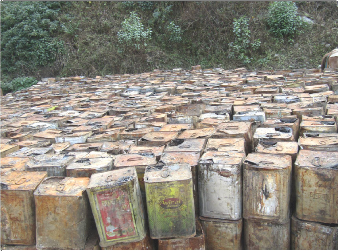
रुकुम पश्चिमको पुर्तिमकाँडा चाईनाबगरमा संकलन गरी राखिएका खोटाका बाकसहरु । पछिल्लो समय सामुदायिक बनहरुको आम्दानीको स्रोत खोटे बनेको छ । तस्वीर रेखदेख