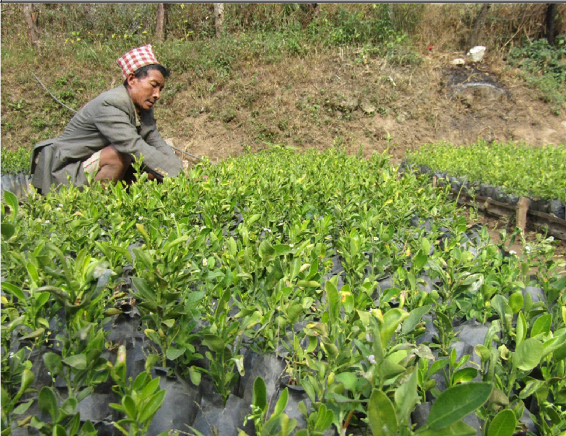
रुकुम पूर्वको मोरावाडमा फलफुलका विरुवा गोडमेल गर्दै स्थानीय किसान । पछिल्लो समय यस क्षेत्रमा फफूल खेतीतर्फ आकर्षण बढेको छ ।