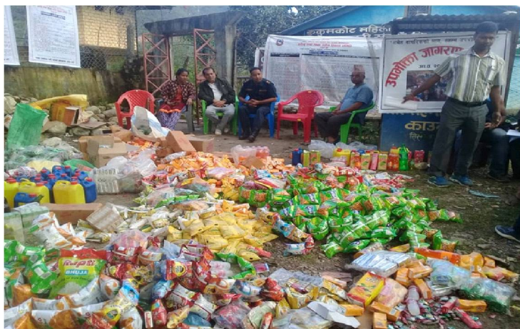
बजार अनुगमनको क्रममा रुकुम पूर्वको रुकुमकोटमा भेटिएको म्याद गुर्जिएको सामग्रीहरु ।

रुकुम पश्चिममा बजार अनुगमन सुरु छ । नेपालीहरुको महान चाँड दशै तिहार नजिकीएसँगै बजार अनुगमन तिब्र पारिएको हो । मुसीकोट नगरपालिकाले पश्चिम रुकुमको सदरमुकाम मुसीकोट आसपासका क्षेत्रमा आईतबार बजार अनुगमन गरेको छ ।