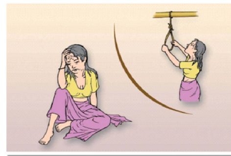
एकलै बस्न रुचाउने, मन आत्तिइरहने, अरुको कुरा सुन्दैमा झर्को लाग्ने, निद्रा नपर्ने वा बारम्बार आत्महत्याको विचार आएमा .....