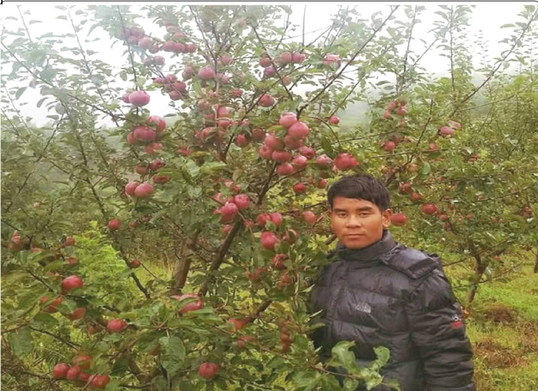
रुकुम पूर्वको तकसेरामा बगैचामा फलेको स्याउ देखाउदै स्थानीय किसान । सडकको पहुँच नहुँदा यहाँ उत्पादन भएको स्याउले बजार पाउन सकेको छैन । तस्वीर रेखदेख