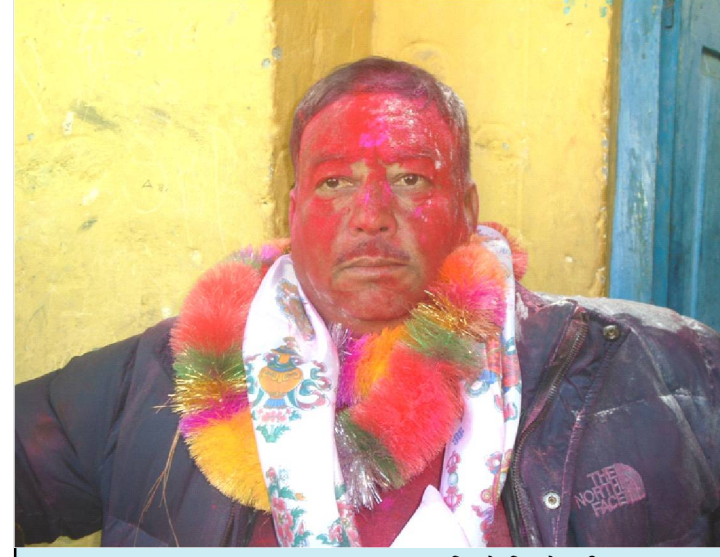
रेखदेख समाचार मुसीकोट