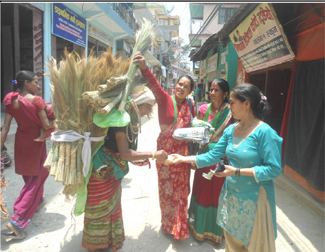
रुकुम पश्चिमको सदरमुकाम खलगासा विक्रीको लागि ल्याएका अमिसोका कुचोहरु । अमिसोको कुचाको मागसँगै मुल्य बढेपछि, गाउँका किसानहरुले अमिसो खेती गर्न थालेका छन् ।