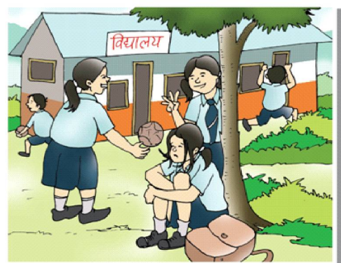
बालबालिकामा पनि टोलाउने, बढी चक्चक् गर्ने, डराउने, चुप लागेर बस्ने नसक्ने ... जस्ता समस्या देखिएमा .....

नजिकैको स्वास्थ्य संस्थामा उपचार र मनो-परामर्शका निम्ति तुरुन्तै लैजाउँ ...!