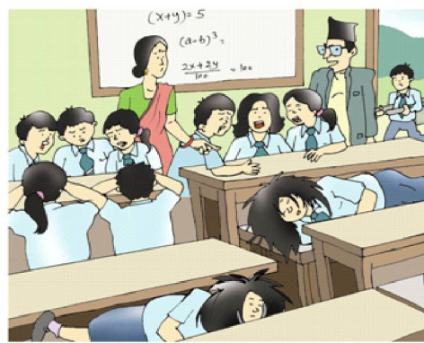
डराउने, आत्तिने, रुने र स्कूलमा एकपछि अर्को गर्दै बेहोस हुने समस्या देखा परेमा .....