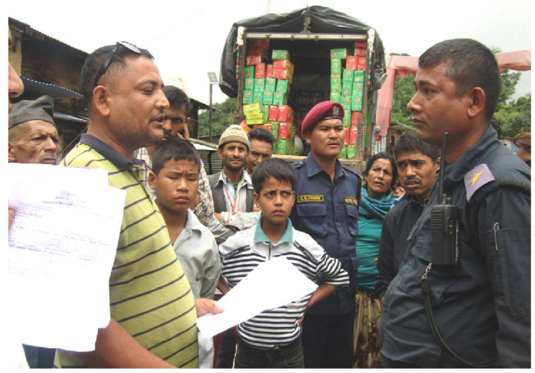
जिल्लाको मुख्य नाका भुल्लेटाबाट मुसीकोट ल्याउन लागेको मदिरा बोकेको ट्रक रोकेपछि, विरोध गर्दै व्यापारीहरू।