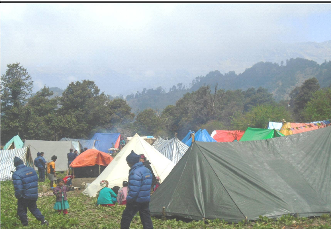
यार्सा संकलनको लागि रुकुम पूर्वका लेक तथा पाटनहरूमा पुगेका यार्स संकलकहरू । यस क्षेत्रमा रुकुम पूर्व पश्चिमका साथै रोल्पा, जाजरकोट लगायतका सयौं स्थानीयहरू पुग्ने गर्दछन् ।