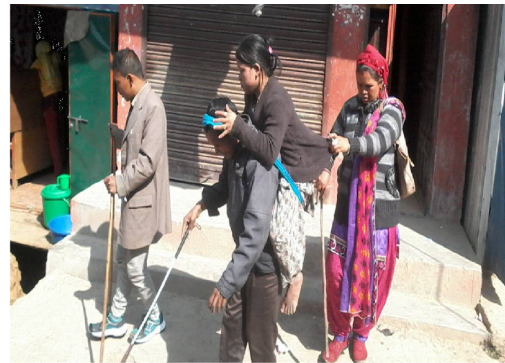
विधिवतको पहिचान सहित मर्यादा र आत्मसम्मानपूर्वक जीवनयापन गर्न पाउने र सार्वजनिक सेवा तथा सुविधामा समान पहुँचको हक हुनेछ भन्ने व्यवस्था उल्लेख गरिएको छ, नेपाल पक्ष राष्ट्रभई हस्ताक्षर गरी सकेको अपाङ्गता भएका व्यक्तिका अधिकारसम्बन्धी राष्ट्रसंघीय महासन्धि, २००६ लगायत सबै अन्तर्राष्ट्रिय मञ्चहरूमा भौतिक संरचना अपाङ्गतामैत्री बनाउने नेपालले लिखित रूपमा प्रतिबद्धता जनाई सकेको छ । अबको भौतिक संरचनाहरूको निर्माण गर्दा अपाङ्गतामैत्री बनाउने अपाङ्गतासम्बन्धी राष्ट्रिय नीति तथा कार्ययोजना, २०६३ मा समेत उल्लेख छ । अपाङ्गता भएका व्यक्तिका अधिकार सम्बन्धी ऐन, २०७४ मा अपाङ्गता भएका व्यक्तिले सबै सेवा सुविधामा उनीहरूको पहुँच स्थापित गर्न सबै भौतिक तथा सूचना सञ्चारमा समेत अपाङ्गतामैत्री बनाउनु पर्ने व्यवस्था छ । अपाङ्गताका सवालहरूलाई यथाशिघ्र सम्बोधन नगरे भन्नु चुनौती थपिने अपाङ्ग संरक्षण मञ्चका जिल्ला अध्यक्ष भिमबहादुर डाँगी बताउँछन् । उनी भन्छन्, 'संरकारी वेवास्ताका कारण कानून तथा नीति कार्यान्वयन नभएका हुन् ।'

जम्मा १३५ जना, 'ख' वर्गका ४७९ जना, 'ग' वर्गका ६६९ जना, 'घ' वर्गका ४८३ जना र श्रेणीकरण नगरिएका ९८४ जना गरी कुल २ हजार ७ सय ४२ जना अपाङ्गता भएका साविकको महिला तथा बालबालिका कार्यालय रुकुम पश्चिमले सार्वजनिक गरेको तथ्याङ्कले देखाएको छ । तथ्याङ्क अनुसार सबैभन्दा बढी मुसीकोट नगरपालिकामा ६४९ जना रहेका छन् । त्यस्तै आठविसकोट नगरपालिकामा ४३४ जना, चौरजहारी नगरपालिकामा ४८९ जना, सानीभेरी गाउँपालिकामा ३ सय ८६ जना, बाँफीकोट गाउँपालिकामा ३६० जना र त्रिवेणी गाउँपालिकामा ४ सय ३२ जना अपाङ्गता भएका व्यक्ति रहेका छन् । जसमध्ये महिला ११३९ र पुरुष १६९१ जना रहेको महिला तथा बालबालिकाका कार्यालयको ०७५ जेठमा सार्वजनिक गरेको तथ्याङ्कमा उल्लेख छ ।