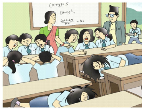
डराउने, आत्तिने, रुने र स्कूलमा एकपछि अर्को गर्दै बेहोस हुने समस्या देखा परेमा .....