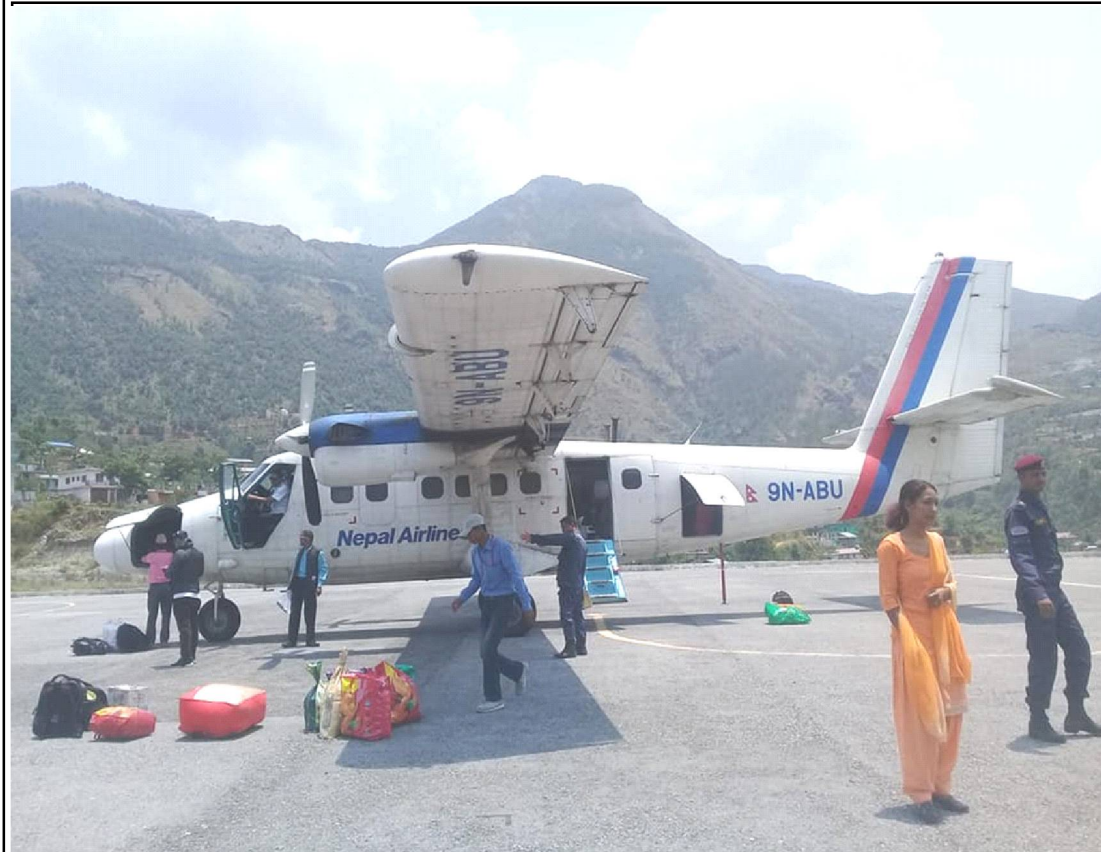
रुकुम पश्चिमको सल्ले विमानस्थल दुई हप्ताको लागि हवाई सेवा बन्द गरिएको छ। विशेषगरी पाइलटहरु तालिममा गएको कारण जेठ २३ देखी असार ७ सम्म दुई हप्तालाई हवाई सेवा बन्द गरिएको हो। असार ९ गतेबाट पुनः सेवा संचारु हुने नागरिक उड्यन प्राधिकरण सल्ले रुकुमले जानकारी दिएको छ।