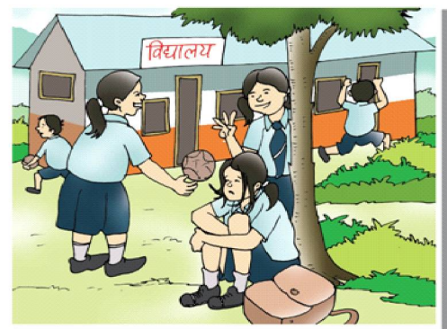
बालबालिकामा पनि टोलाउने, बढी चक्कक् गर्ने, डराउने, चुप लागेर बस्ने नसक्ने ... जस्ता समस्या देखिएमा .....

नजिकैको स्वास्थ्य संस्थामा उपचार र मनो-परामर्शका निम्ति तुरुन्तै लैजाउँ ...!