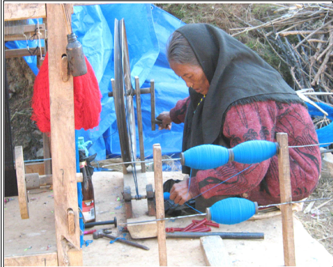
घरेलु तान मार्फत धागो काट्दै रुकुम पूर्वकी एक महिला । यहाँका महिलाहरु स्थानीय कचचा पर्दाथको प्रयोग गरेर राडिपाखी निर्माण गर्ने गर्दछन् ।