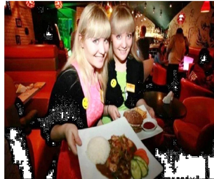
विश्वमा कैयन् यस्ता अनौठा खालका रेस्टुरेन्टहरु छन् जो कुनै आश्चर्यभन्दा कम छैनन् । ती रेस्टुरेन्टमा विचित्र कुरा देख्न मात्र होइन, स्वाद लिन पनि पाइन्छ ।

■ पश्चिमी हालिउडस्थित ओपाक्यू क्याफे नामको एक रेस्टुरेन्ट रहेको