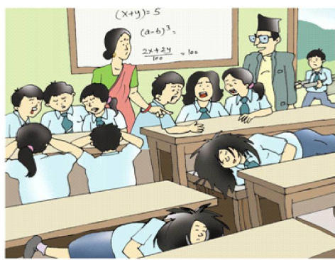
डराउने, आत्तिने, रुने र स्कूलमा एकपछि अर्को गर्दै बेहोस हुने समस्या देखा परेमा .....