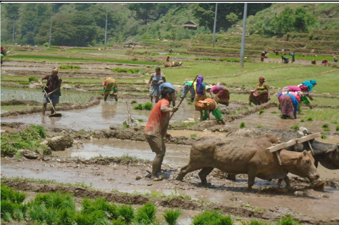
समयमा पानी नपर्दा रुकुम पश्चिमको किसानले खेतबारीको काम गर्न सकेका छैनन् । आकासेपानीको भरमा खेतीपाती गर्दै आएका किसानहरु लामो समयसम्म पानी नपर्दा मकै रोप्ने तथा धानको व्याड (वीउ राख्ने) अष्टेरो परेको बताएका छन् ।