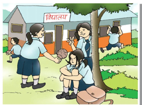
बालबालिकामा पनि टोलाउने, बढी चक्कक् गर्ने, डराउने, घुप लागेर बस्ने नसक्ने ... जस्ता समस्या देखिएमा .....

नजिकैको स्वास्थ्य संस्थामा उपचार र मनो-परामर्शका निम्ति तुरुन्तै लैजाउँ ...!