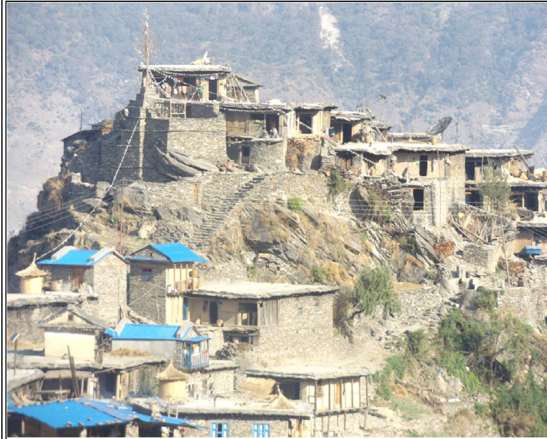
रुकुम पूर्वको रमणीय तथा पर्यटकीय गाउँ रन्मामैकोट गाउँ ।