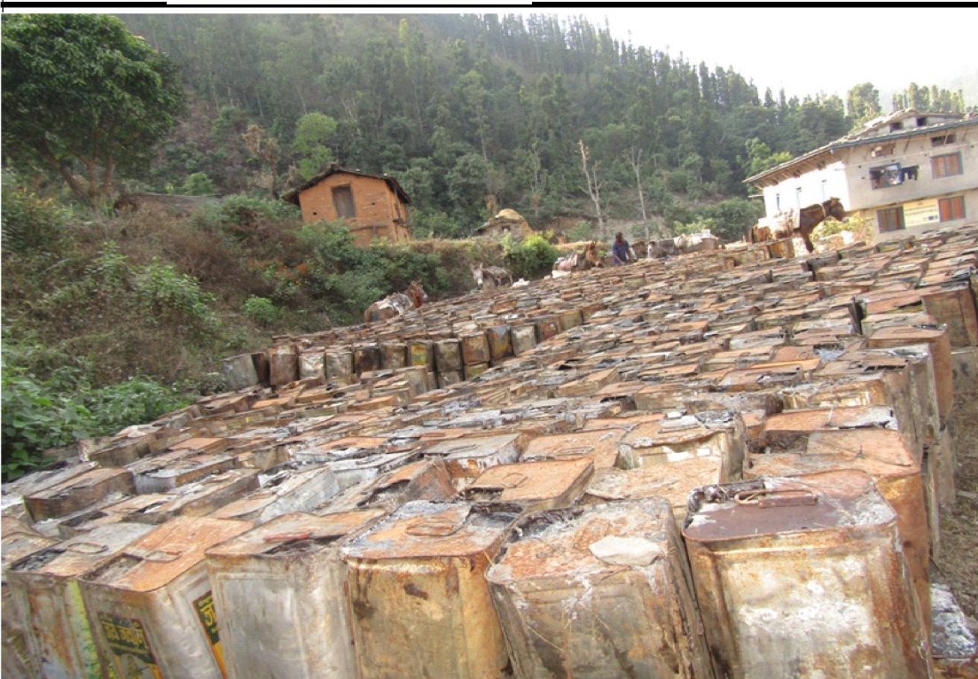
रुकुम पश्चिमको सामुदायिक नहरबाट संकलन गरिएको खोटोको बाकसहरु । पछिल्लो समय खोटो विक्रीबाट सामुदायिक वनहरुले आम्दानी गर्न थालेका छन् ।