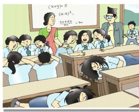
डराउने, अगति, रुने र स्कूलमा एकपछि अर्को गर्दै बेहोस हुने समस्या देखा परेमा .....