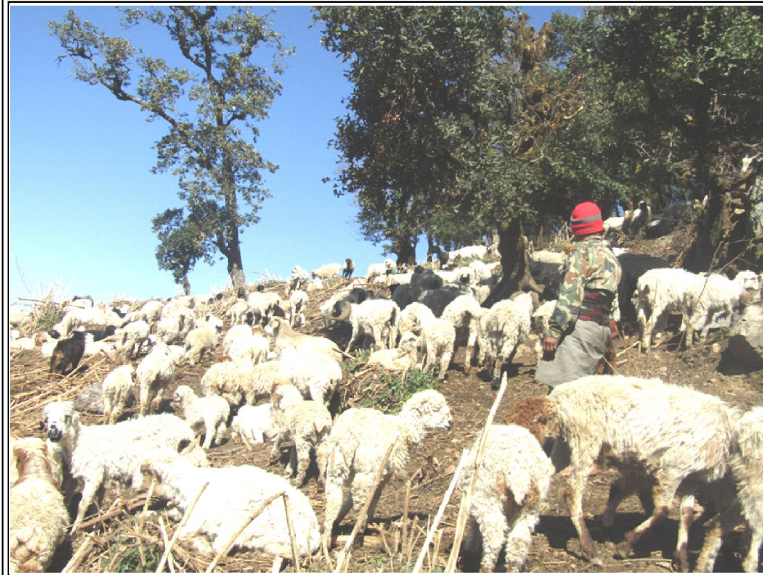
रुकुम पूर्वको जंगलमा भेडा चराउदै स्थानीय भेडापालन व्यवसायी । लामो खडेरी भएसँगै जंगलमा भेडाको लागि चरण अभाव रहेको भेडापालन व्यवसायी बताएका छन् । तस्वीर : रेखदेख

हिमाली छापाखाना एण्ड स्टेशनरी पसल हामीकहाँ फोटोकपी, लेमिलेसन, स्क्रिन प्रिन्ट, फोटो प्रिन्ट, पाठ्यपुस्तक, पत्रपत्रिका, कपडाको भोला छपाई, स्टेशनरी सामान, भिजिटीङ्ग कार्ड, विवाह कार्ड, शुभकामना कार्ड, कम्प्युटर टाईपिङ्ग, स्क्रानिङ्ग, एमआरपी फारम भर्नुका साथै इमेल इन्टरनेट सेवा समेत प्रदान गरिन्छ ।