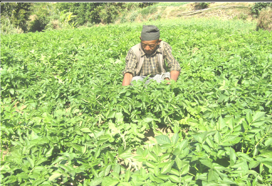
बेमौसमी तरकारी खेतीमा स्थानीय किसानहरु । गाउँ गाउँमा सडक पुगेपछि स्थानीय किसानहरु व्यवसायी तरकी खेतीमा आर्कषित भएका छन् ।