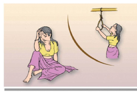
एकै बस्न रुचाउने, मन अतिइरहने, अरुको कुरा सुन्दा भर्को लाग्ने, निद्रा नपर्ने वा बारम्बार आत्महत्याको विचार आएमा .....