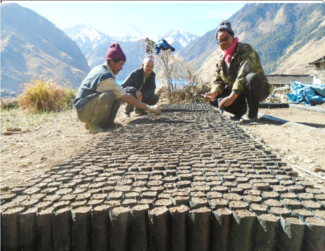
रुकुम पूर्वको तकसेराका किसान स्याउको नर्सरी तयार गर्दै । पछिल्लो समय रुकुम पूर्वको तकसेरा लगायतको क्षेत्रमा सडक पुगेपछि यहाँ किसानहरु व्यवसायी स्याउ खेती सुरु गरेका छन् ।